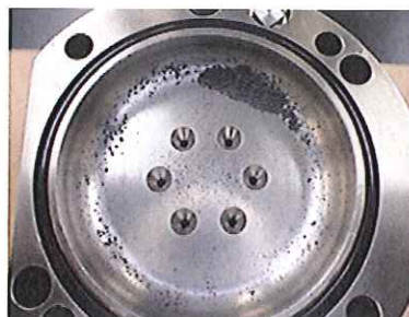
図 2 捕集後の装置内部写真例 (2 段階ジェットノズル上流部)